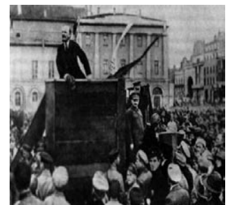
Revolución rusa de 1917

REVOLUCIÓN RUSA. Lenin escribió en 1918: "Si, nuestra revolución es burguesa en tanto que marchamos con el campesinado en su conjunto... Al principio con 'todo' el campesinado contra la monarquía, contra los propietarios, contra el medievalismo (y, hasta este punto, la revolución sigue siendo burguesa, democráticoburguesa). Después con el campesinado más pobre, con el semiproletariado; con todos los explotados contra el capitalismo, que significa también contra los campesinos ricos. los 'kulaks' y los especuladores; y en este aspecto, la revolución se convierte en socialista. La mayor perversión del marxismo, su vulgarización, su sustitución por el liberalismo significa colocar una muralla china entre una y otra revolución, separar una y otra por otro elemento que no sea el grado de preparación del proletariado y el grado de unidad por los campesinos pobres" (E. H. Carr).