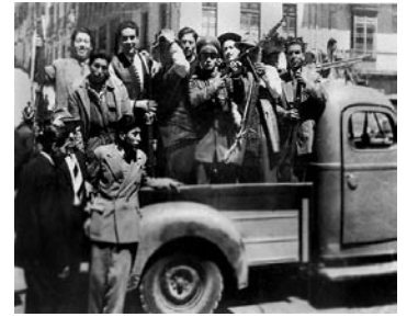
Revolución del 9 de Abril de

REVOLUCIÓN DEL 9 DE ABRIL DE 1952. El Movimiento Nacionalista Revolucionario, contando con la complicidad de Antonio Selemé, ministro de gobierno de la época, proyectó un típico golpe de Estado, en el que estaba comprometido el dirigente sindical Juan Lechín Oquendo. El golpe se transformó en revolución social gracias a la participación de las masas populares y principalmente del proletariado, debido a la prolongación del choque entre las fuerzas armadas oficialistas y golpistas. Así, de manera confusa, se expresó la rebelión de las fuerzas productivas contra el superestado minero, el gamonalismo, 1952 formas de la feudal-burguesía y también contra la opresión imperialista. La nación oprimida vino movilizándose y luchando alrededor de las consignas centrales de la