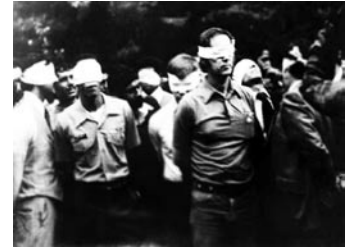
Rehenes en Teherán

REHENES EN TEHERÁN. El 4 de noviembre de 1979, cuatrocientos estudiantes islámicos de Teherán ocuparon la embajada de los EEUU de N. A. exigiendo la extradición del ex-Sha, que se encontraba internado en un hospital en Nueva York desde el 22 de octubre de 1979. Tomaron como rehenes a funcionarios norteamericanos y los cincuenta y dos que quedaron fueron liberados el 20 de enero de 1981, día en que juró su cargo el presidente R. Reagan, a cambio de importantes concesiones.