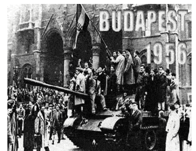
Honor a los muertos en defensa de las libertades